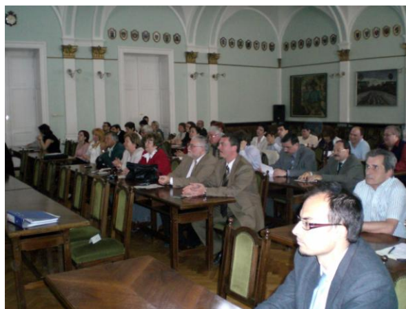
Tájékoztató Nap 2010.05.04.